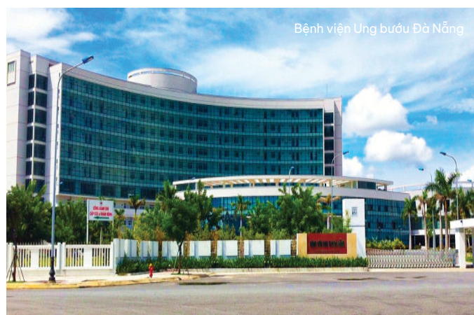
Bệnh viện Ung bướu Đà Nẵng