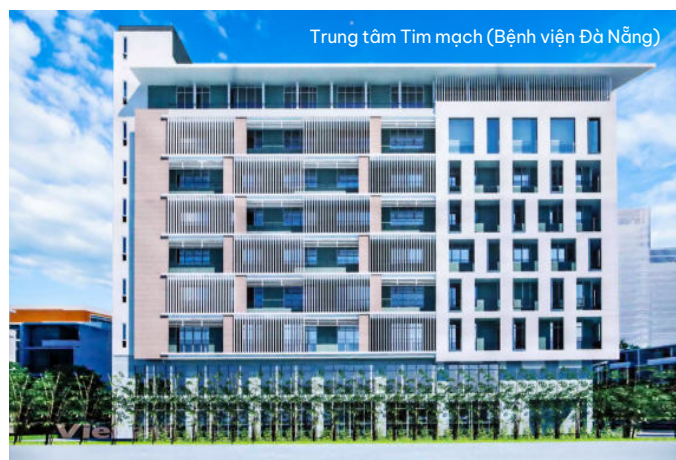
Trung tâm Tim mạch (Bệnh viện Đà Nẵng)